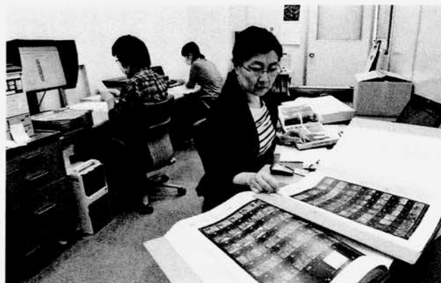
準備室でのデータ化作業