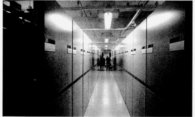
フィルムセンターフィルムの収蔵庫

写真フィルムを収蔵する施設について、平成24年5月31日、文化庁と公益社団法人日本写真家協会(JPS)は「独立行政法人国立美術館東京国立近代美術館フィルムセンター相模原分館の一部使用に関する覚書」(文化庁次長河村潤子)を締結し、本年度からこの施設に写真フィルムを収蔵することになった。