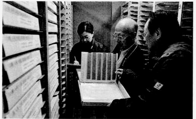
収蔵された写真フィルム