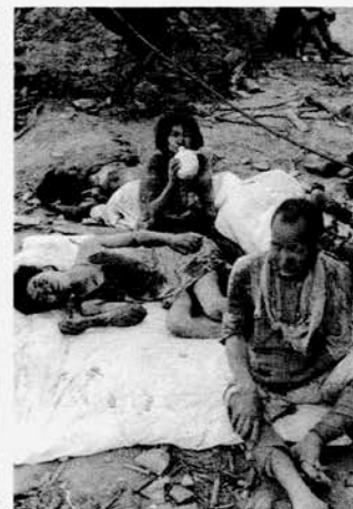
A9-8 市の連絡員がもって来た少量の水を廻し飲みしている。