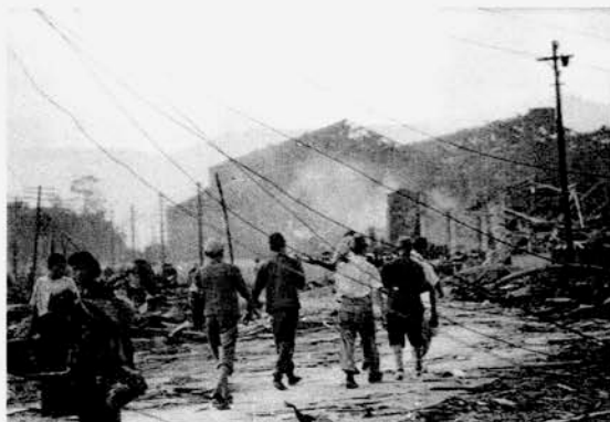
A9-26 8月10日午前6時頃、稲佐橋付近。負傷者の収容がやっとはじめられた。