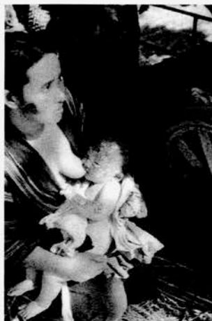
A9-22 負傷者は順番を待つのも放心状態だった。道ノ尾駅前。8月10日午後2時頃。