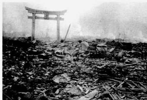
A9-4 爆心地付近の被害状況。石の鳥居だけが不思議に原形をとどめていた。