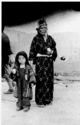
A13-2 炊き出しのお握り一つ。食べる元気もない。

山端が長崎でとらえた原爆記録のフィルムは115コマが印刷物等で確認されているが、現在残っているものは寄託された68コマ(ホルダー数にして3本)だけである。このフィルムのパーフォレーションにはA9(31コマ)、A12(6コマ)、A13(31コマ)の手書きされた番号が付されているので、実際に撮影された本数は少なくとも、欠けているA10、A11を加えた5本あったと推測することができる。A9のフィルムを詳細に確かめると、現像中にフィルムの一部がくっついて現像されないまま定着され、画像に斑や気泡が生じている。A13ではもっともよく使われてきた「おにぎりを持つ親子」(A13-2)と「おにぎりを持つ少年」(A13-1)の間の2コマは現像時のカブリで画像を見ることができない。また、フィルムの天地を逆さまのまま番記されて、撮影順序通りでないことが分かる。A13-19～24でも、プリント後にネガを天地を逆にしたままネガホルダーへ納めたため、ネガ番号を間違っただけのまま手書きされたことが分かった。